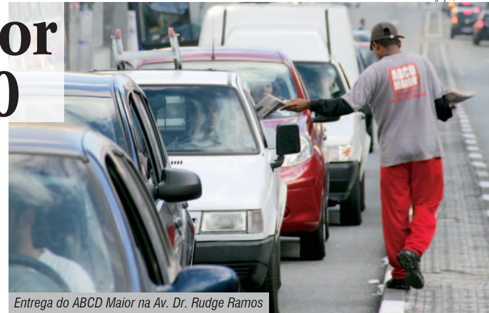
Entrega do ABCD Maior na Av. Dr. Rudge Ramos

Desde a última terça-feira, dez mil exemplares do ABCD Maior são entregues gratuitamente em 20 cruzamentos de cinco cidades na região.